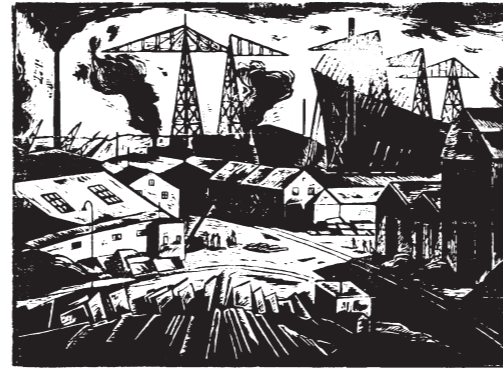
Götaverken – ett träsnitt av Edith Fischerström